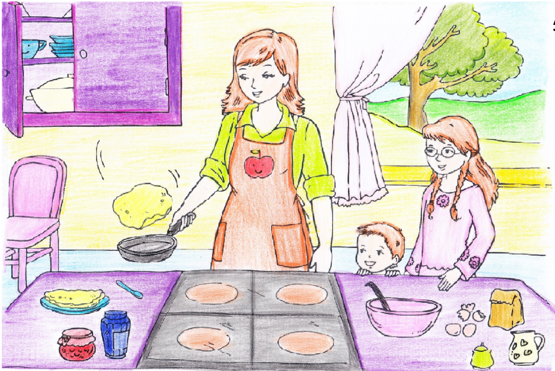
วิถีชีวิตของคนในหมู่บ้าน หาดปาลมาเป็นอาหาร