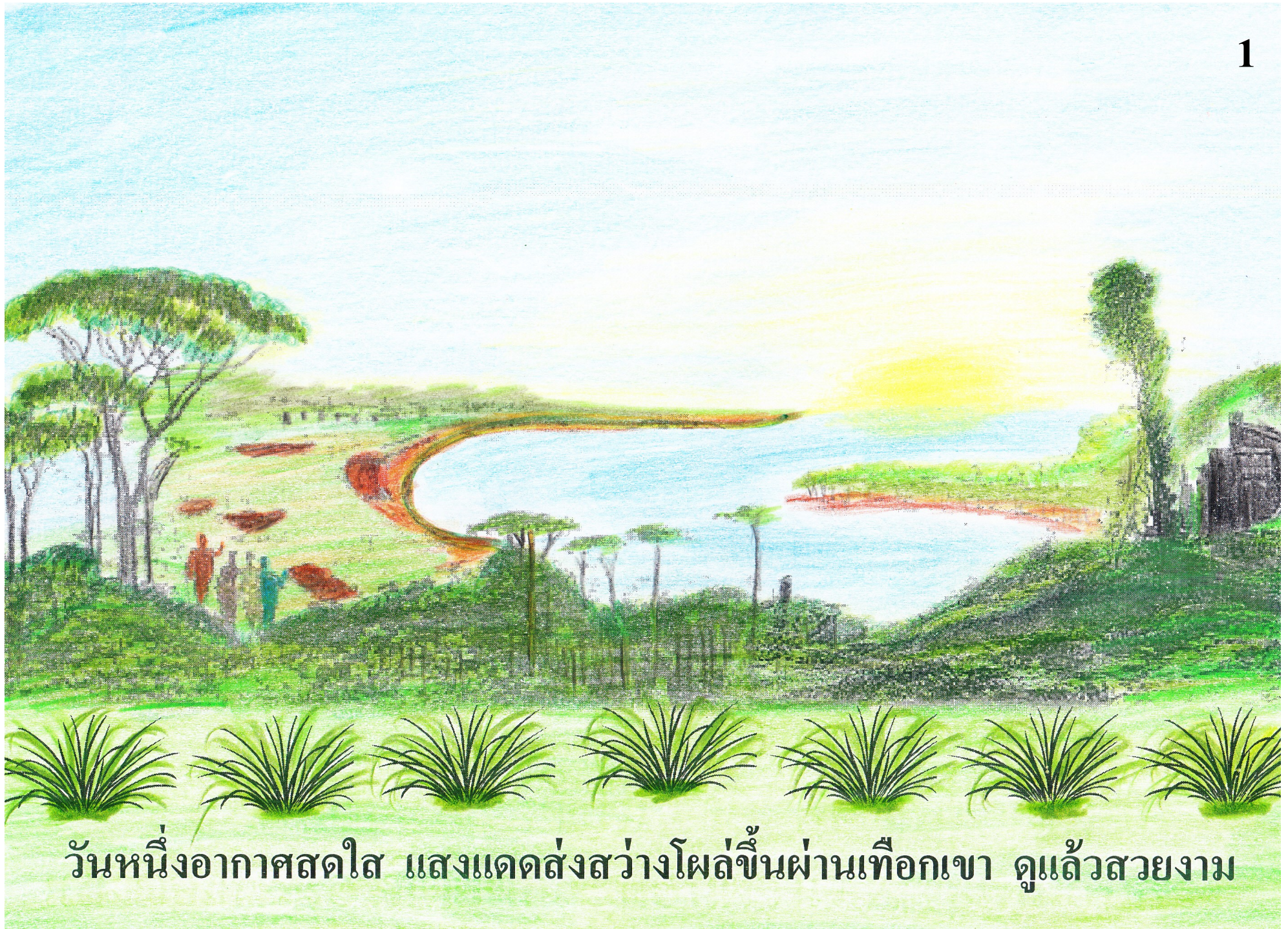
วันหนึ่งอากาศสดใส แสงแดดส่องสว่างโพล่ขึ้นผ่านเทือกเขา ดูแล้วสวยงาม